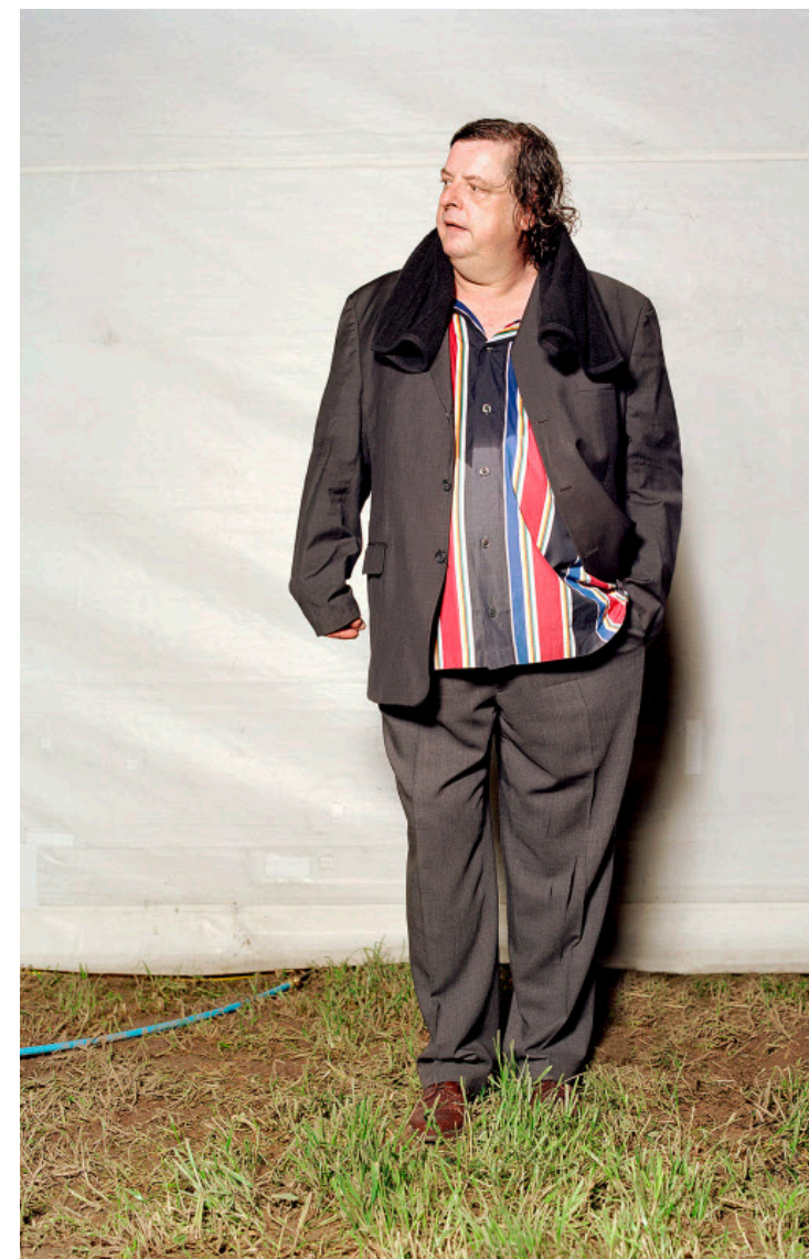
Mit Gartenschlauch: Endo Anaconda hält Ausschau nach der Dusche.