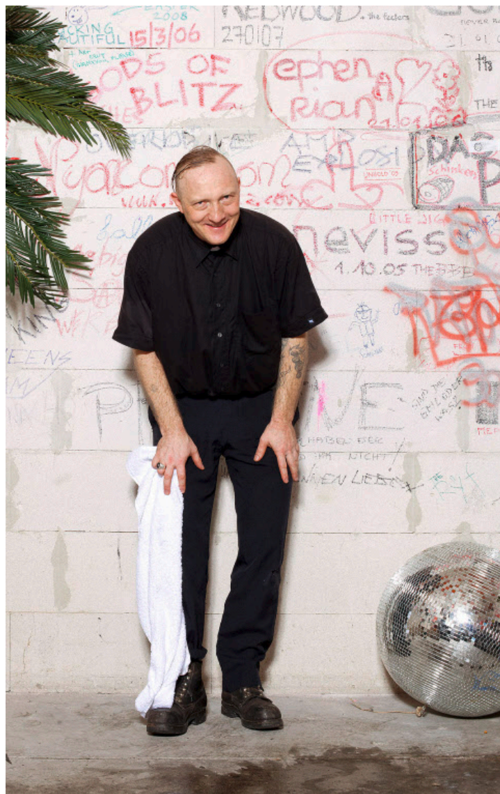
Mit Discokugel: Reverend Beat-Man glänzt auch backstage.